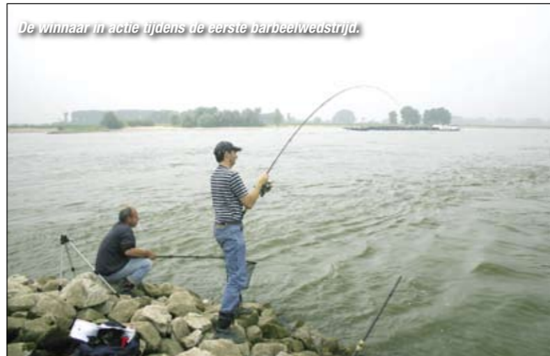
De winnaar in actie tijdens de eerste barbeelwedstrijd.

E én ding is inmiddels duidelijk geworden. Er is eigenlijk maar één vangtuig geschikt om onder extreme omstandigheden gericht op barbelen te vissen: de hengel. Elektrisch afvissen is onmogelijk vanwege de te grote watermassa en het vissen met netten blijkt ondoenlijk door de harde stroming.